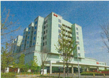
佐賀県医療センター好生館